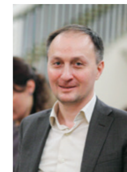
«Решаем проблемы пациентов «от а до я»