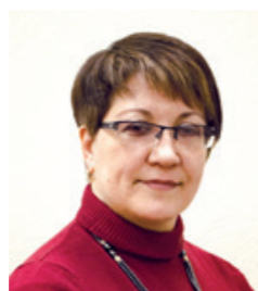
«Поддерживаем молодых специали- стов»