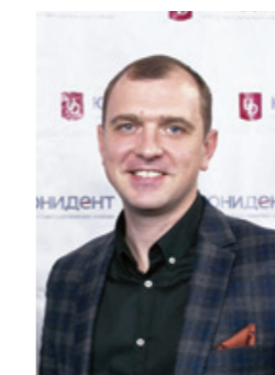
«Делаем качественную стоматологию доступной»

Когда-то мы поставили перед собой задачу сделать качественную стоматологию и технологии доступными. Работая с компанией холдинга UNIDENT, оснащающей клиники, мы имеем доступ к передовым технологиям по самым лучшим ценам. Это позволяет транслировать доступные услуги и нашим клиентам. Говоря о качестве, я также считаю важной проделанную нами работу по юридической защите каждого из