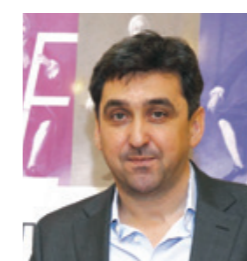
«Клиники Юнидент хорошо знают в Москве»