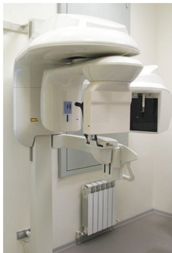
Клиники осна- щены оборудо- ванием самого высокого класса

У нас сильнейший медицинский персонал, и сейчас только около 10% соискателей, которые приходят на собеседование, могут «взять эту высоту». Конечно, подбирать кадры всегда было и будет сложно. Потому что уровень образования врачей далеко не всегда высокий, в отличие от наших требований. Чтобы решить эту проблему, мы открыли Центр развития карьеры — и всегда рады талантливым молодым врачам. Привлекая перспективных студентов выпускных курсов, мы даем им возможность пройти путь от ассистента врача до специалиста узкого профиля высокого класса. Также у нас работает учебный центр, где сотрудники Юнидент, а с некоторого времени и сторонние специалисты, могут получить или усовершенствовать свои навыки. В будущем мы планируем превратить центр в площадку постдипломного образования — и опять же она станет дополнительным источником профессиональных кадров для наших клиник.